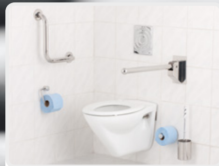
WC-Anlage nach DIN 18040-2

Maßnahme zur Wohnumfeldverbesserung nach § 40 Abs. 4 SGB X