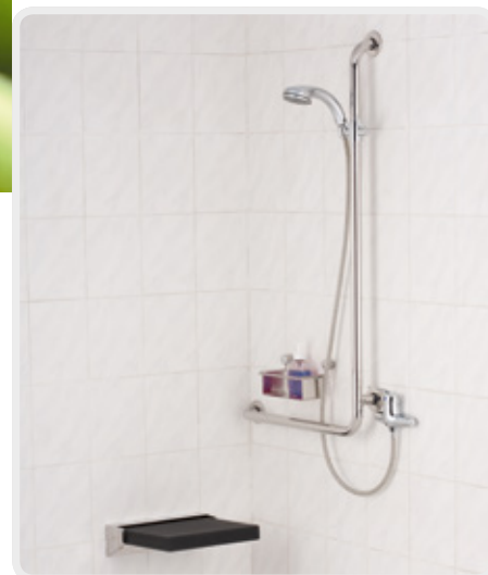
Dusch-Anlage nach DIN 18040-2