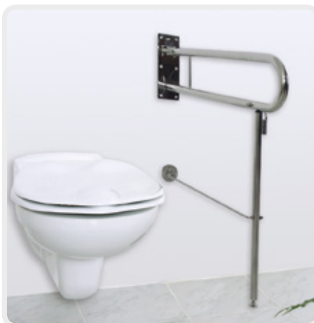
Sicherheits-Stützklappgriff mit klappbarer Bodenstütze