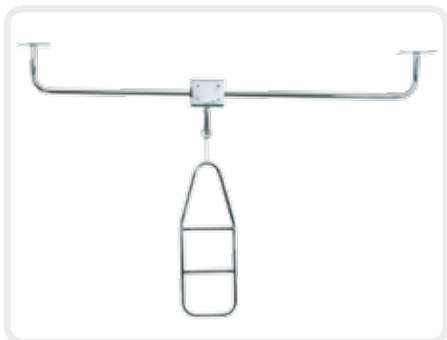
Umsetzhilfe für Rollstuhlfahrer