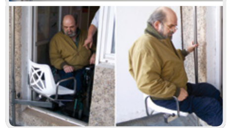
Drehsitz-Kombination als Umsetz- und Einstiegshilfe