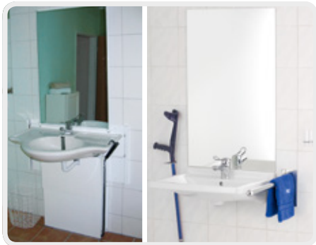
Waschtisch-Anlage nach DIN 18040-2