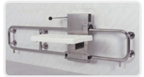
Sicherheits-Duschklappsitz, manuell fahrbar als Sitz- und Umsetzhilfe