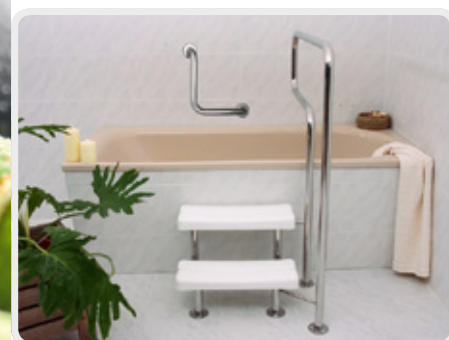
Badewannen-Bereich nach DIN 18040-2